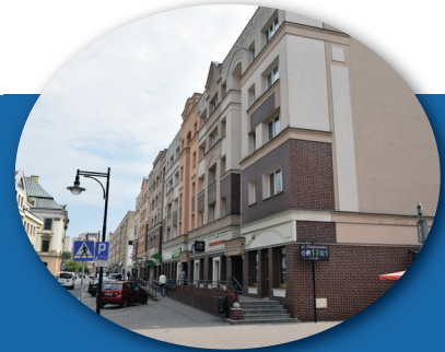
Lokal użytkowy LSM przy ul. Chojnowskiej 19 w Legnicy