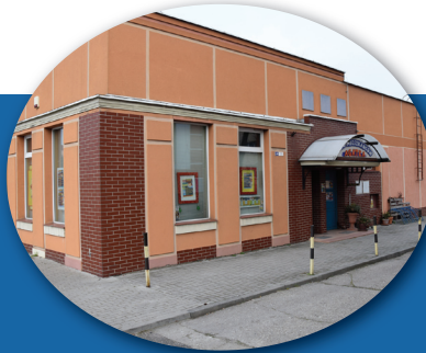
Klub Mieszkańców „Agatka” przy ul. Artyleryjskiej 40f w Legnicy