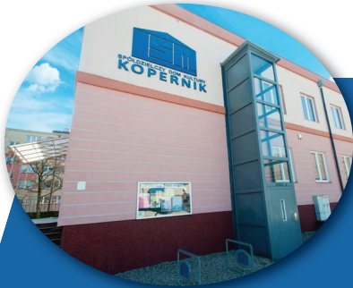
Spółdzielczy Dom Kultury „Kopernik” przy ul. Koziorożca 14 w Legnicy

Członkowie mogą głosować w jednym z wymienionych punktów niezależnie od miejsca zamieszkania. Głosować można w następujących punktach: